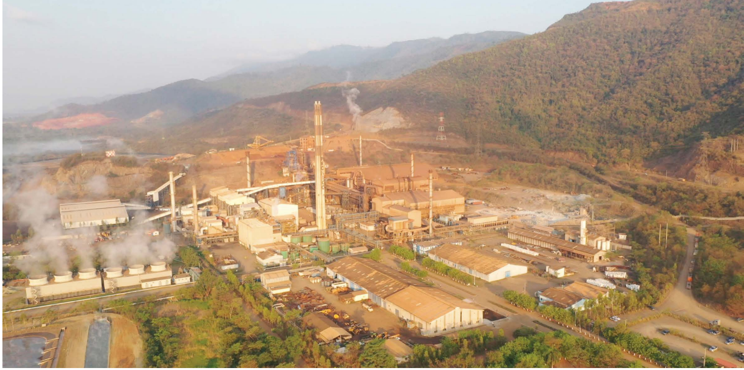
Planta de la minera rusa en El Estor, Guatemala.